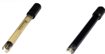
SONDA AMBER Sonda ORP

INCLUIDO: Función Bluetooth, permite visualizar y cambiar valores con el móvil + App EPOOL gratuita, con la que puede actualizar el software.